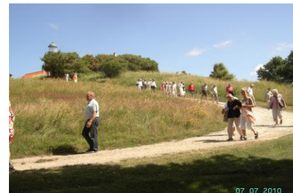
Vandring i bakkerne