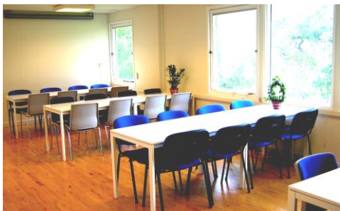
MØDELOKALE nr. 4