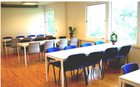
MØDELOKALE nr. 4